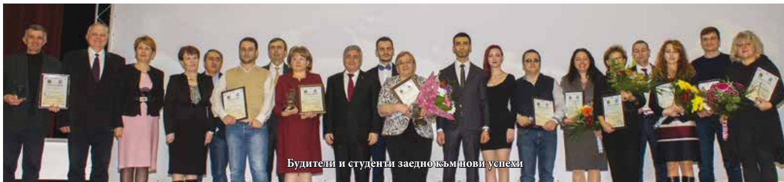
Будители и студенти заедно към нови успехи

дух и култура. Те са превели народа ни през тъмните периоди от нашата история. Били са пътеводната звезда, която е дала светлина и смисъл. Проправяли са пътеката, по която, вървейки заедно, сме се превърнали в това, което сме днес.